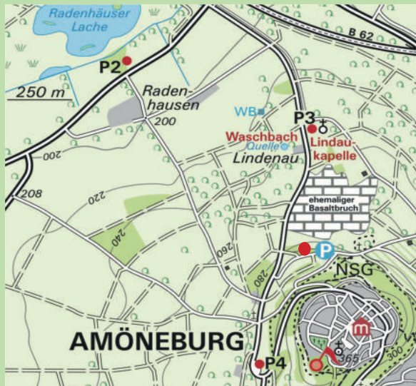
P2 Radenhäuser Lache (gegenüber Hofgut Radenhausen an der L3088)