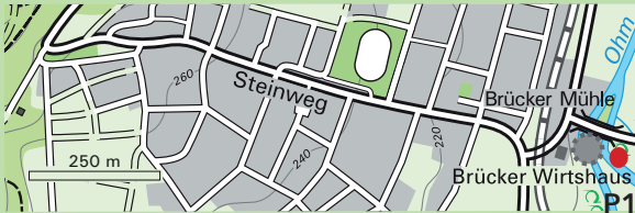
P1 Brücker Mühle (im Gelände hinter der Mühle)